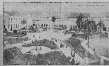
PLAZA DE SAN FRANCISCO